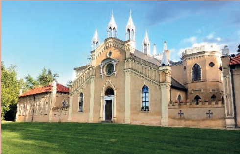
Das Gotische Haus