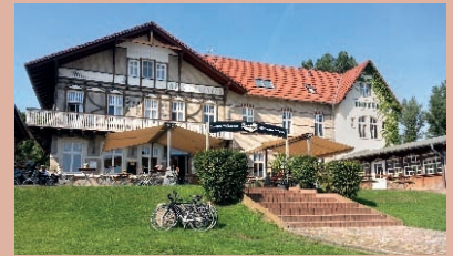
Hotel und Gaststätte Elbterrasse Wörlitz

Die Wörlitzer Anlagen sind der bekannteste und meistbesuchte Teil des von Leopold III. Friedrich Franz von Anhalt-Dessau gegründeten Gartenreiches. Dieses, im Biosphärenreservat Mittel-elbe gelegen, umfasst etwa 142 km 2 . Neben Wörlitz gehören dazu die Schlösser und Parks Georgium, Luisium, Leiner Berg und Sieglitzer Berg (siehe Tour 9) sowie Mosigkau, Großkühnau, und Oranienbaum . (siehe Tour 6)