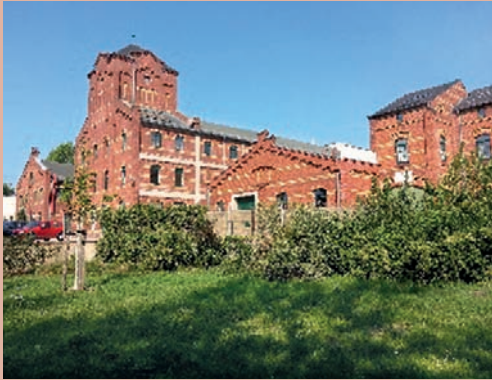
Sanierte Gründerzeitbauten in Wittenberg-West