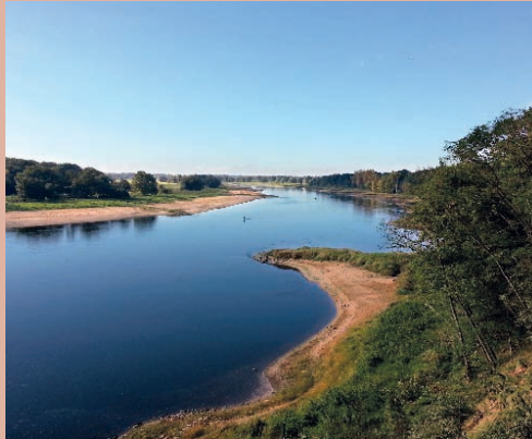
Blick vom hohen Elbufer