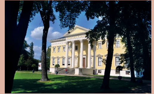
Das Schloss im Wörlitzer Park

Goethe, Forster und andere Vertreter der geistigen Elite der Zeit waren beim Fürsten zu Gast. Aber von Anfang an hatte auch das einfache Volk Zugang zu den Anlagen. Seit dem Jahr 2000 gehören sie zum UNESCO-Weltkulturerbe.