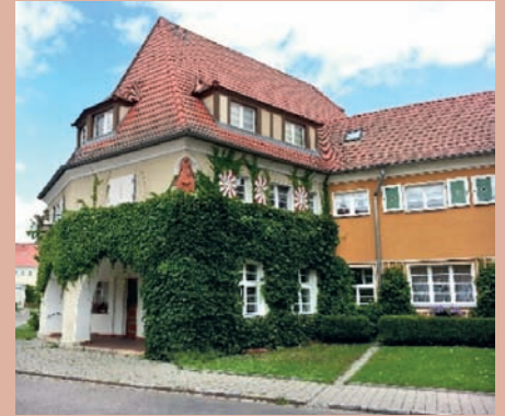
In der Werkssiedlung Piesteritz

Die Werkssiedlung Piesteritz entstand zwischen 1916 und 1919 unter anderem nach den Plänen des Schweizer Architekten Salvisberg für die Arbeiter und Angestellten des Stickstoffwerkes. Als Gartenstadt bot sie für die damalige Zeit vorbildliche Lebensbedingungen und war eine autarke städtebauliche Einheit mit Rathaus, Schule, Kirche, Kauf- und Vereinshaus. Diese Gebäude bilden mit den Reihen- und Einzelhäusern der Bewohner bei aller Vielfalt eine überzeugende gestalterische Einheit. Wegen ihrer vorbildlichen städtebaulichen Lösungen steht die Siedlung heute unter Denkmalschutz und wurde im Jahr 2000 als Expo-Projekt vollständig saniert. Durch behutsame Veränderungen der Grundrisse bei Erhaltung der historischen Außenansichten und durch die Entscheidung der Bewohner für eine autofreie Siedlung entstand ein Wohnquartier mit hoher Lebensqualität.