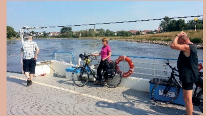
Auf der Fähre in Coswig