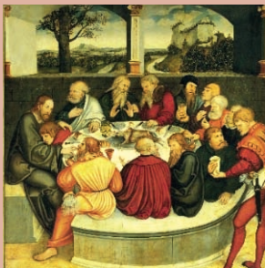
Cranachaltar in der Stadtkirche (Mittelteil)

Herausragende Bedeutung haben die Cranachhöfe . Das Vorderhaus Markt 4, vermutlich Geburtsort von Cranach d.J., dient jetzt Ausstellungszwecken. In den Hofgebäuden betreiben verschiedene Kunsthandwerker ihre Werkstätten. Die Schlosstraße 1 war einst Sitz der berühmten Malerwerkstatt, in der Vater und Sohn, unterstützt von zahlreichen Gesellen, an die 3000 Gemälde schufen. Die Apotheke der geschäftstüchtigen Familie, in der auch Gewürze, Wein, Farben u.a. verkauft wurden, befindet sich noch immer hier. Der Südflügel beherbergt heute eine Malschule und eine historische Druckwerkstatt.