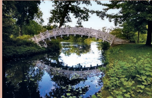
Die Weiße Brücke