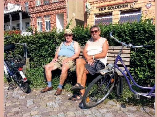
An der Elbterrace Kleinwittenberg

Das alte Kornhaus am Hafen zeugt noch von dessen einstiger Bedeutung als Umschlagplatz. Gegenwärtig ist er Heimat des Wasser- und Schifffahrtsamtes und dient als Schutzhafen bei Hoch- bzw. Niedrigwasser oder Eisgang. Die Touren der MS Wittenberg auf der Elbe beginnen ebenfalls hier. Nach der Entfestigung der Stadt im 19. Jahrhundert begann auch in Wittenberg die Gründerzeit . Westlich der Altstadt entstanden zahlreiche Fabriken im Stil des Historismus. Die meisten von ihnen wurden nach der Wende geschlossen. Einige der imposanten Klinkergebäude wurden restauriert und beherbergen heute zum Beispiel Handelseinrichtungen, Büros und Fitnessstudios.